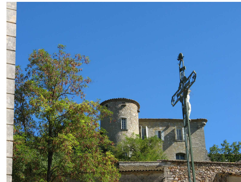
La Bastide d'Engras

Le village, dominé par un château médiéval, est composé essentiellement d'une communauté agricole complétée par de nombreuses secondes résidences respectant l'habitat traditionnel.