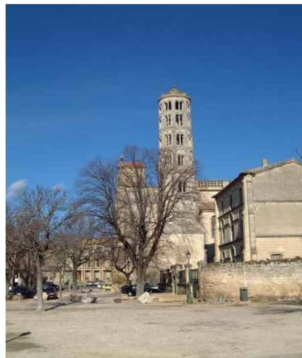
Uzès: tour Fenestrelle